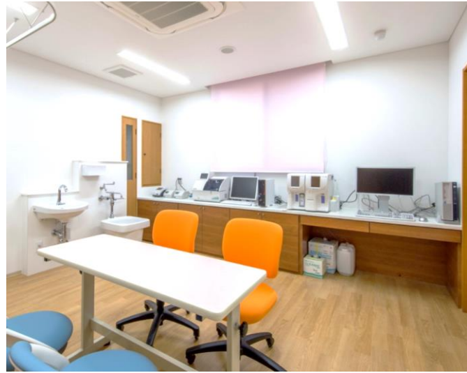
特殊検査機器が充実した検査室