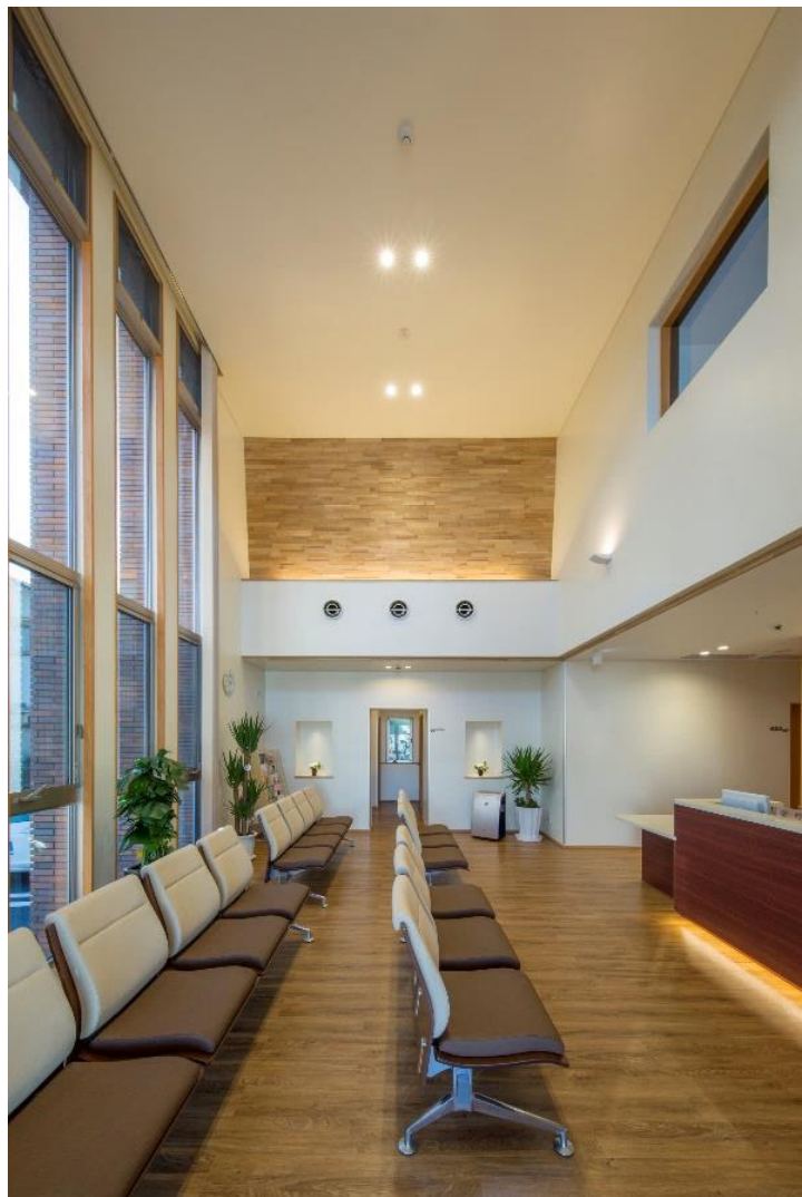
待合室のおおらかな吹き抜けは、 ナチュラル色基調のインテリアと 相まって温もりを漂わせています。