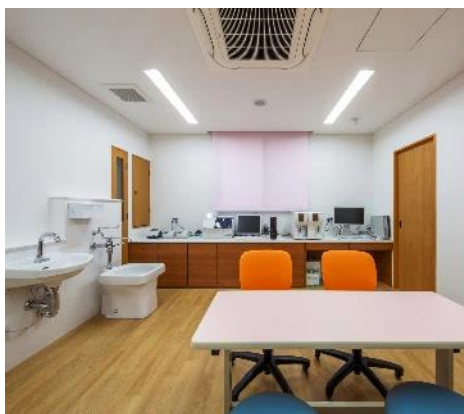
生化学検査など様々な検査に 対応いただいております。