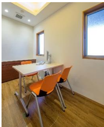
患者様のプライバシー を考慮した問診室。