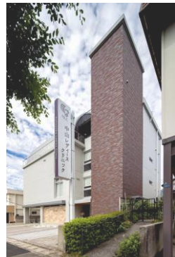
別府市石垣西 中山レディースクリニック様