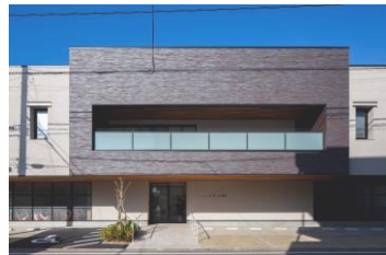
7.5大分市下郡 いしい産婦人科医院 様