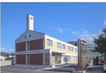
大分市横塚 ひらかわ産婦人科医院 様